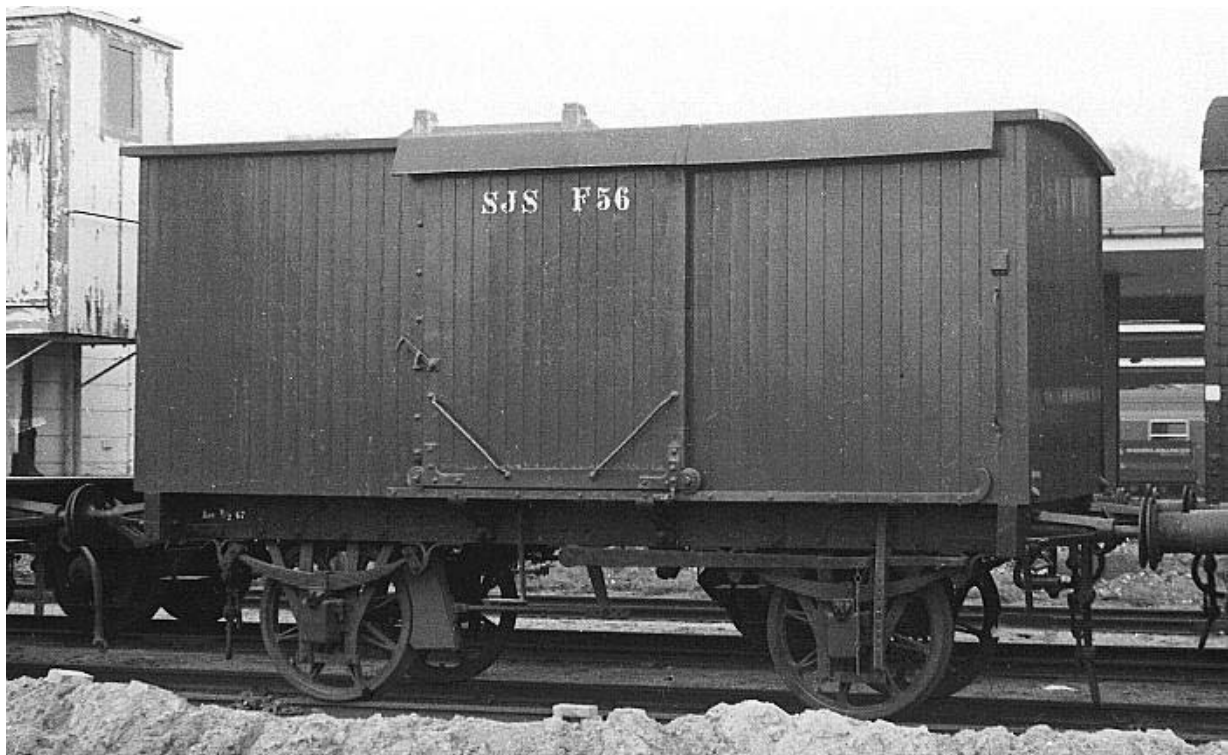
Jernbanemuseets SJS F56, som egentlig er nr 59, Odense 3.10.1976